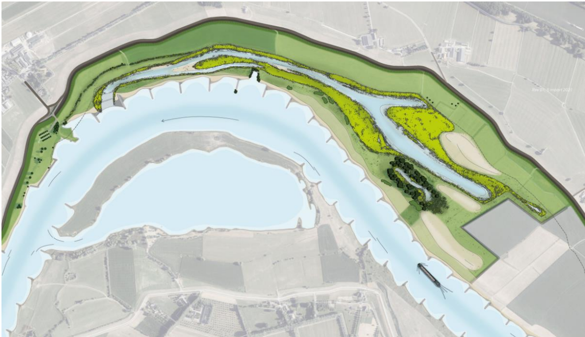
Figuur 1, Verbeelding van het project natuurontwikkeling en kleiwinning Schalkwijker Buitenwaard na herinrichting.